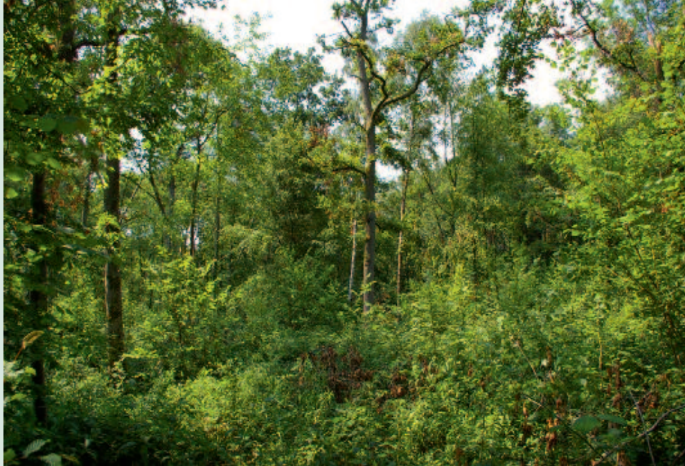
Foto 2. Ongelijkvormig hooghout bij Le Nouvion-en-Thiérache in Noord-Frankrijk, juli 2009.

maar het verschilt daarvan op enkele essentiële punten. Het systeem richt zich op het creëren van een bosstructuur met een bovenetage van opgaande bomen (de reserve) en daaronder een struiklaag waarin de jonge bomen groeien die na selectie als een nieuwe generatie aan de reserve worden toegevoegd. De reserve bestaat uit verschillende generaties bomen, met een vaste verhouding in stamtallen tussen de verschillende generaties (tabel 1). De kapcyclus en de aantallen te behouden bomen zijn afhankelijk van de groeisnelheid van de bomen en het gewenste aantal generaties. In de praktijk wordt een kapcyclus aangehouden van 15 à 20 jaar, afhankelijk van de groeiplaats. Bij elke ingreep wordt een vast percentage bomen uit elke generatie van de reserve weggekapt en wordt vrijwel de gehele struiklaag afgezet. Een vast aantal jonge bomen wordt gespaard en als jongste generatie aan de reserve toegevoegd. Het beheer in het ongelijkvormig hooghout is gericht op de groei van kwalitatief hoogwaardig hout in de reserve. De diameterverdeling van de verschillende generaties in de reserve van een ongelijkvormig hooghout is qua vorm vergelijkbaar met de diameterverdeling van het klassieke uitkapbos, zoals in Midden-Europa wordt toegepast. Het grote verschil is dat in het ongelijkvormig hooghout minder frequent, maar wel veel intensiever wordt ingegrepen in de bosstructuur om voldoende licht op de bosbodem te brengen voor het laten opgroeien van een nieuwe generatie