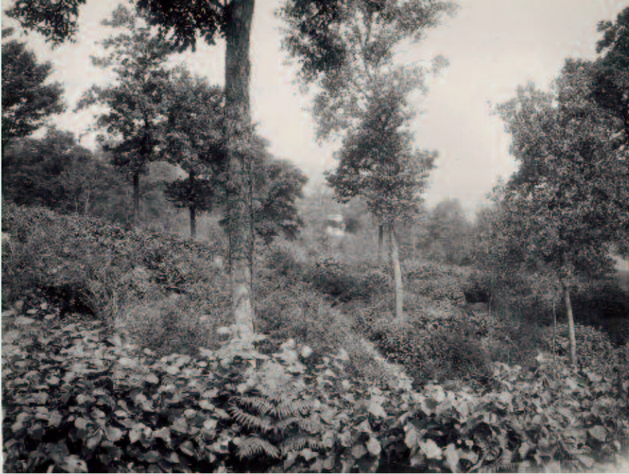
Foto 1. Savelsbos in de jaren '20 van de vorige eeuw (foto: archief Freek van Westreenen).

bedroeg slechts tien tot twaalf jaar, wat het aandeel snelle groeiers, zoals Hazelaar ( Corylus avellana ), sterk bevorderde. De oogst van de overstaanders gebeurde naar behoefte. Echt oud werden de bomen doorgaans niet, mede door het telkens terugkerend oorlogsgeweld (vóór 1800). Wat nu nog te zien is in de hellingbossen zijn overblijfselen van een boscultuur uit de 19de eeuw. Na de Tweede Wereldoorlog is de tijd van hakhout met overstaanders voorbij.