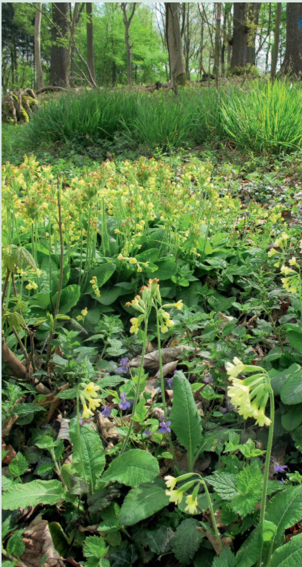
Foto 5. Kaplaktevegetatie in het half-open deel van het Wijlrebos in het tweede groei-seizoen na de kap. Bosplanten als Slanke sleutelbloem ( Primula elatior ), Eenbloemig parelgras ( Melica uniflora ) en Donkersporig bosviooltje ( Viola reichenbachiana ) zijn sterk toegenomen.

Grote vraag is ook hoe de reserve zich in de periode tot de volgende kap zal gaan ontwikkelen. Cruciaal hierbij is dat de verjonging die nu opgroeit voldoende eiken, kersen en essen van goede stamkwaliteit bevat, die bij een volgende ingreep aan de reserve kunnen worden toegevoegd. Om voldoende eiken en kersen te garanderen zijn deze aangeplant. Es verjongt zich voldoende, maar het is afwachten of de Es zich voldoende kan gaan handhaven met de komst van Chalara fraxinea , de schimmel die essentaksterfte veroorzaakt. Het beheersysteem richt zich op het laten opgroeien van bomen met een hoge stamkwaliteit, waardoor op termijn de inkomsten uit beheer kunnen worden vergroot. Tegelijkertijd zullen bij de geplande langere rotatieperiode de bomen uit de onderlaag van het bos grotere diameters bereiken waarmee de oogstkosten naar verwachting lager kunnen zijn dan bij een traditioneel middelhoutbeheer (met kortere rotatieperiodes en daardoor veel meer kleinere te oogsten stammetjes). Slimme oogsttechnieken en technologische ontwikkeling kunnen leiden tot verdere kostenbesparingen die voorwaarde zijn om de benodigde ingrepen op duurzame wijze voort te kunnen zetten.