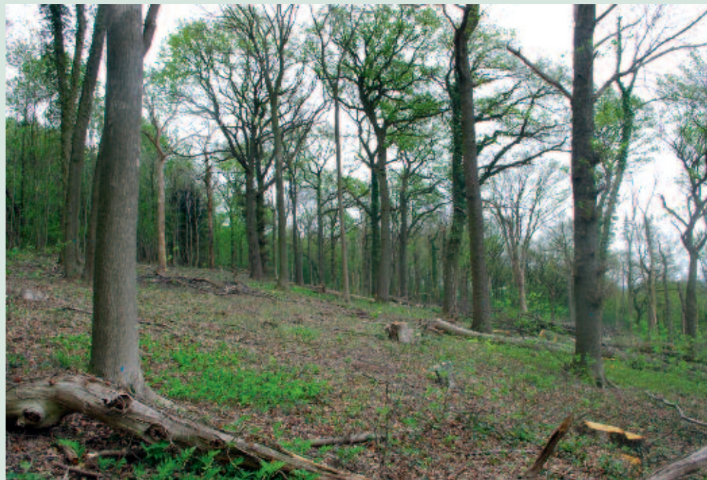
Foto 3. Eyserbos, kort na de kapwerkzaamheden. Op de voorgrond het proefvak met de laagste kroonsluiting (35%), daarachter het proefvak met een kroonsluiting van 55% en op de achtergrond het niet gekapte referentievak.

in de ontwikkeling van de vaatplanten gegeven (voor een gedetailleerd overzicht zie Hommel et al., 2015). In beide gebieden heeft de ingreep geleid tot een grote toename van het soortenaantal, vooral bij de laagste kroonbedekking (fig. 2a). De sterke toename werd voor een belangrijk deel veroorzaakt door karakteristieke lichtafhankelijke soorten van bosranden en kapvlakten, en door algemene soorten die in het huidige cultuurlandschap geen relatie met bossystemen hebben (foto 4). Veel van de nieuw verschenen soorten hebben een langlevende zaadbank, bijvoorbeeld gras-, zegge-, klokjes- en hertschooissoorten (fig. 2b). De meest bijzondere nieuwvestigingen betroffen de Bosdravik ( Bromopsis