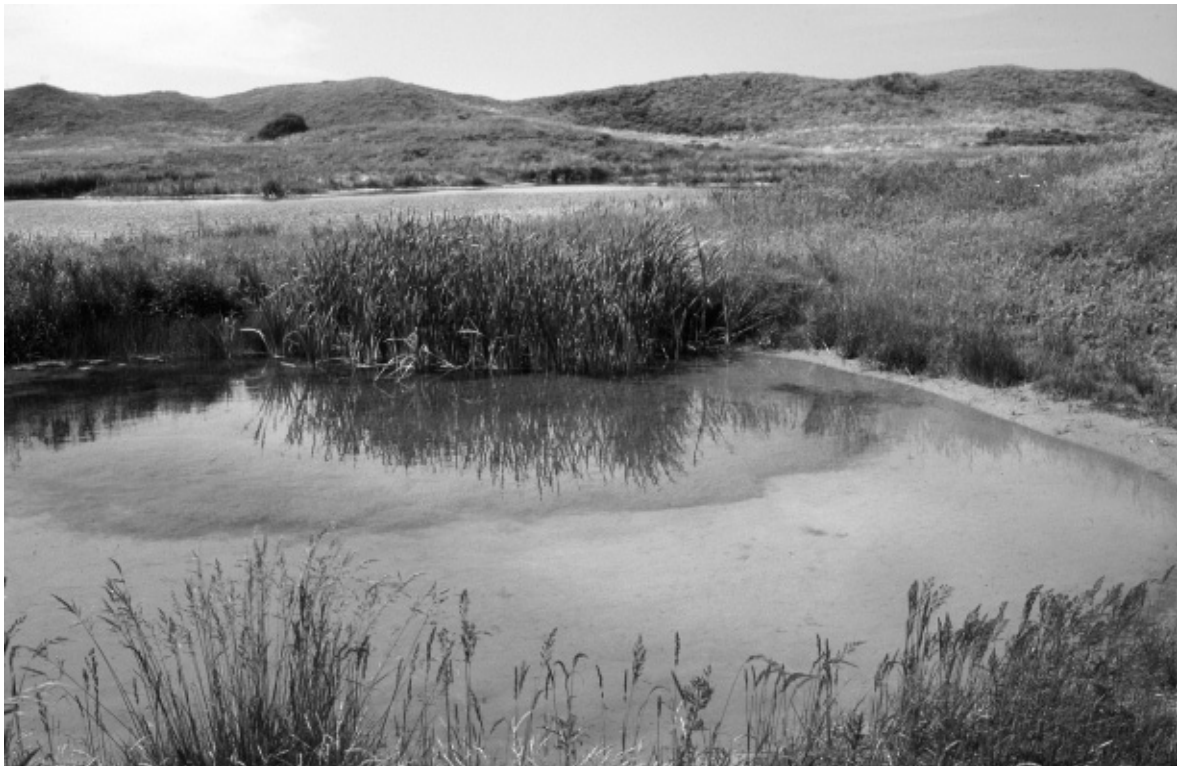
Duinpoel met kranswieren. Infiltratieplas Castricum.

Belangrijk probleem is steeds het omgaan met fosfaat en stikstof: fosfaat is al voor de duininfiltratie verwijderd, maar riet en kruidwilde kunnen bij lage beschikbaarheid van fosfaat toch nog tot een probleem leiden. Maaien en afvoeren van begroeiing leidt dan ook tot betere resultaten dan niets doen.”