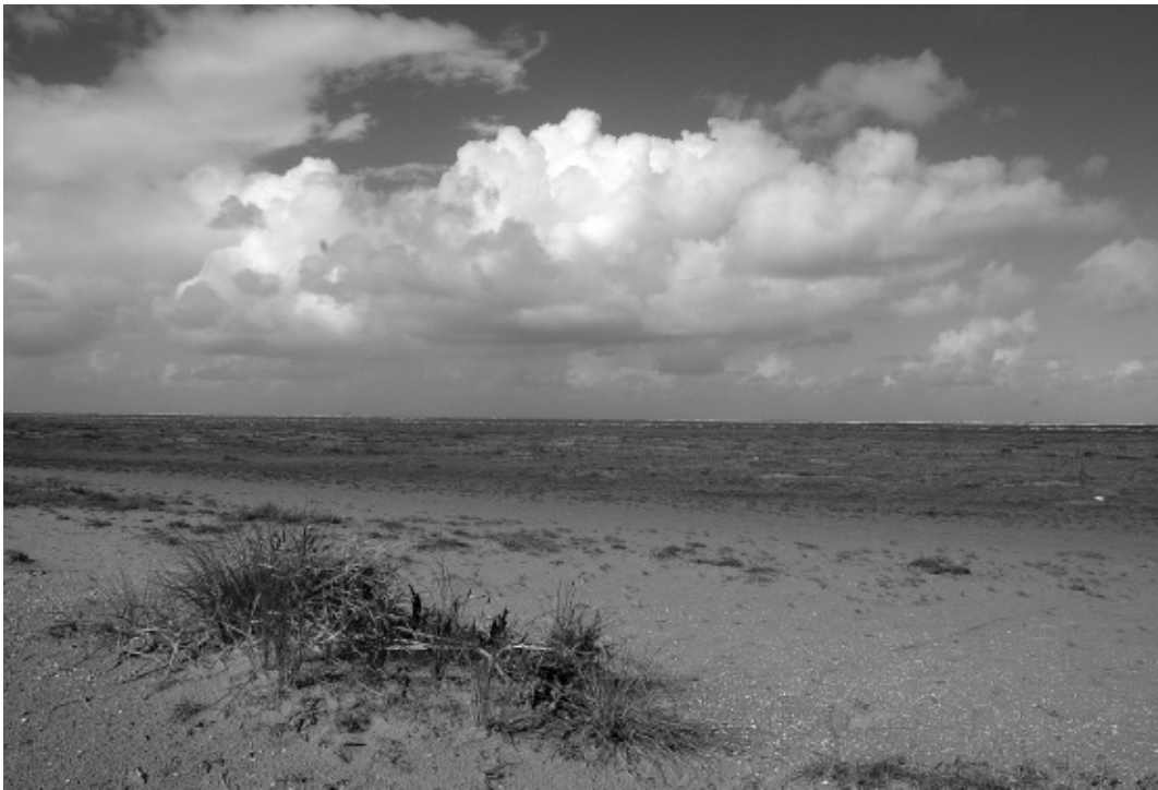
Twee voorbeelden van aangroeiende kusten: Schiermonnikoog en Kwade Hoek