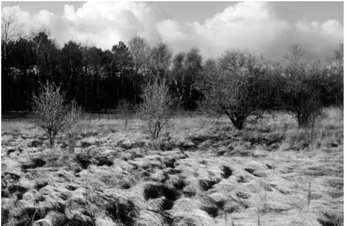
Lokale vergrassing in kalkrijke duinen.