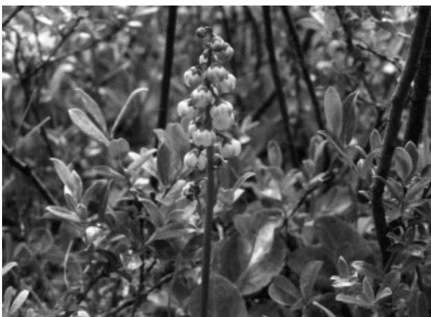
Van boven naar beneden: vleeskleurige orchis, parnassia, teer guichelheil en rondbladig wintergroen.