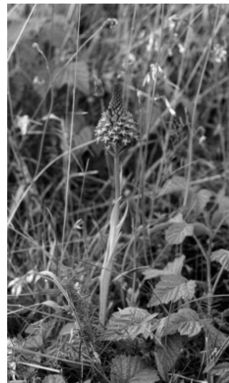
Van links naar rechts: hondskruid, duingrasland, verfbrem en harlekijn.