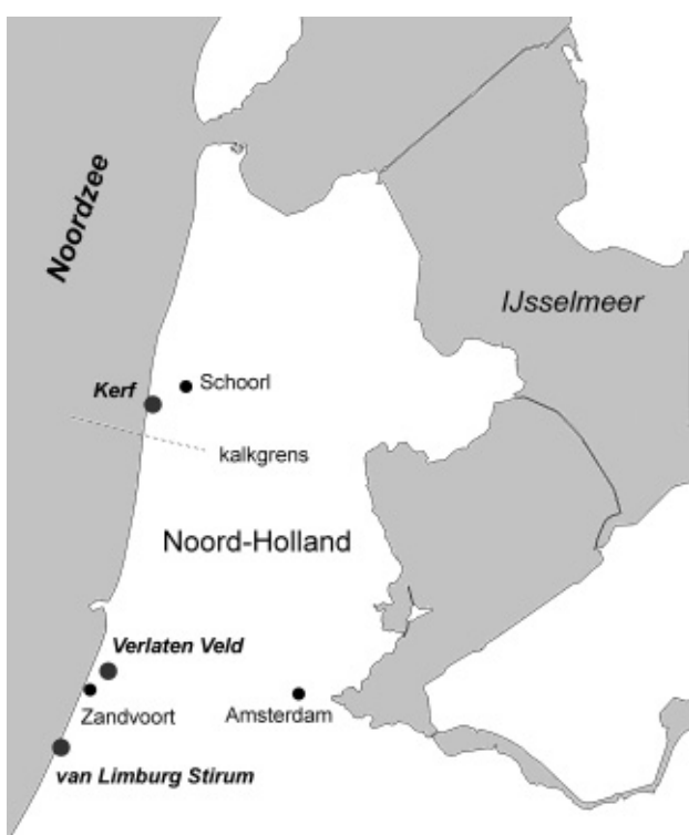
Locaties van experimenten. De gereactiveerde stuifkuilen in de Schoorlse duinen liggen tussen de locatie van De Kerf en Schoorl.

In 1997 is de Kerf bij Schoorl door de zeereep gegraven. Tegelijkertijd werd de achterliggende vallei afgeplagd, en werd het onderhoud van de zeereep gestaakt. Het effect was een geweldige toename van verstuiving van het strand naar de achterliggende, ontcalcite duinen, met incidenteel een enorme impuls door de instroming van zout zeewater. Het belangrijkste resultaat vanuit het oogpunt van duurzaamheid is dat